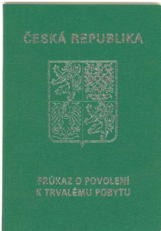
Přední strana dokladu (tmavě zelený doklad ve formě knížky, stříbrný tisk na přední straně)

Doklad o povolení k trvalému pobytu rodinného příslušníka občana EU a (od 1. 1. 2018) vydáván také jako doklad o povolení k trvalému pobytu občanů EU a také občanů Islandu, Lichtenštejnska, Norska a Švýcarska a jejich rodinným příslušníkům.