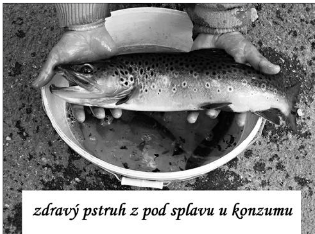
zdravý pstruh z pod splavu u konzumu

V našem pstruhovém revíru se vyskytují chráněné ryby: vranka obecná, mihule obecná, střevele potoční, rak říční. Dále se na povodí můžete setkat s pstruhem obecným,