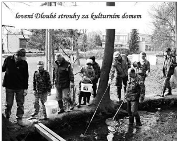
lovení Dlouhé strouhy za kulturním domem

Místní organizace každé jaro pravidelně provádí odlovení násady pstruha obecného, odchovávaného na Dlouhé strouze. Ulovené ryby jsou následně vysazeny do řeky Bělé. Tím zároveň se Dlouhá strouha připravila k vysazení váčkového plůdku pstruha obecného. Do řeky Bělé navíc pravidelně vysazujeme sportovní ryby, pstruha obecného a pstruha duhového.