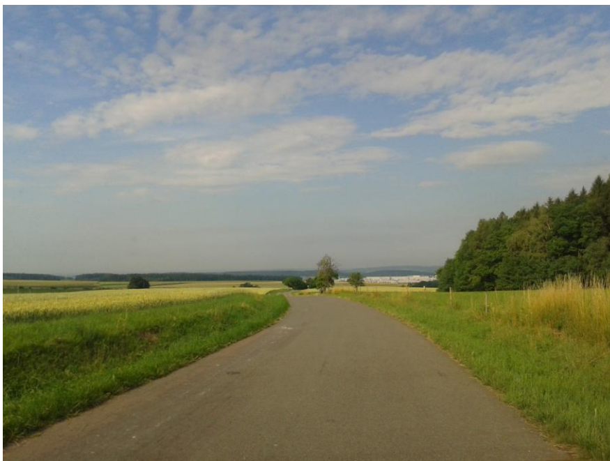
Foto 2 - Pohled od stavby st. p.č. 35 na k.ú. Litohrady (okraj PZ v Lipovce) – díky konfiguraci terénu se PZ významněji uplatňovat v podhledech z tohoto místa nebude

Foto 1 - Pohled od obce Debřece – pohledy z východu budou eliminovány plánovaným ochranným opatřením – valem se zelení a navrženou plochou zalesnění