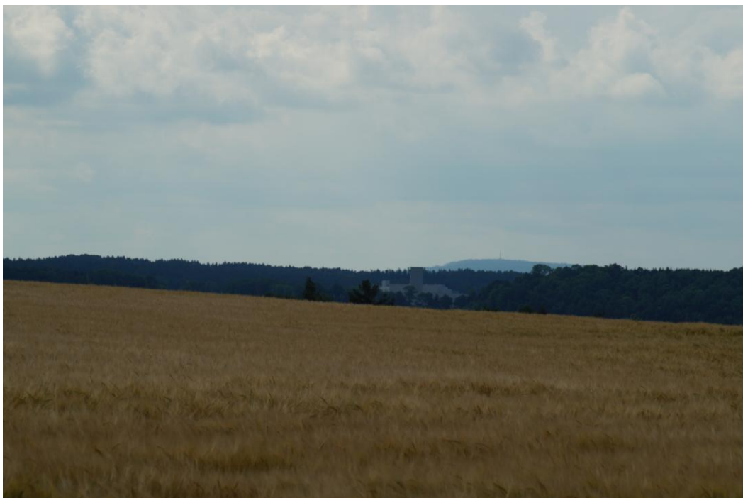
Foto 6 - pohled z vodojemu severně od Hraštic – zástavba v ploše ZI/2 v Kvasinách bude z tohoto místa částečně kryta navrhovaným izolačním opatřením – valem se zelení, zástavba v lokalitě ZI/1 v Solnici se bude uplatňovat maximálně ve vyšších polohách, bude však splývat se zástavbou v rámci stávajícího areálu ŠA