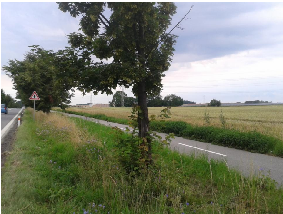
Foto 4 - Pohled od cesty ležící na hranici zastavitelé plochy Z8-1 vymezené v ÚP Solnice. V současnosti je viditelná plocha FVE, za ní ve vyvýšené poloze se nachází prostor, kde by měla být realizovaná zástavba v rámci lokality ZI/1 vymezené Změnou č. 1 ÚP Solnice. Plocha před FVE je součástí PZ dle platného ÚP Solnice a zde v budoucnu realizovaná zástavba bude clonit plochu v lokalitě ZI/1 v pozadí

Foto 3 – pohled z místa mezi PZ Lipovka a PZ Solnice – vlevo stávající halová zástavba v Solnici, již je možno dle platného ÚP rozšiřovat cca po zeleň ve střední části fotografie. Vpravo FVE, za níž se terén částečně zvedá, zde se bude zástavba v rámci nově vymezené plochy ZI/1 uplatňovat