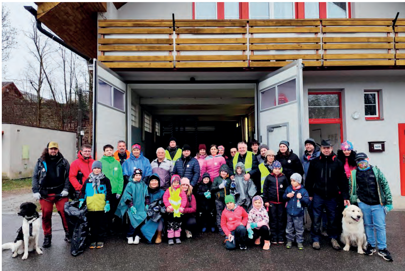
Uklidíme Kvasiny - 29.3.2026