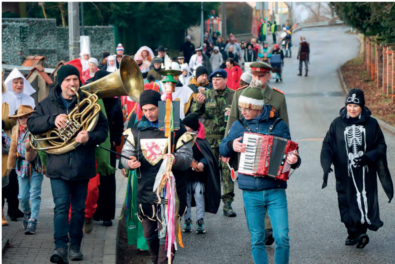
Masopustní průvod - 14.2.2026